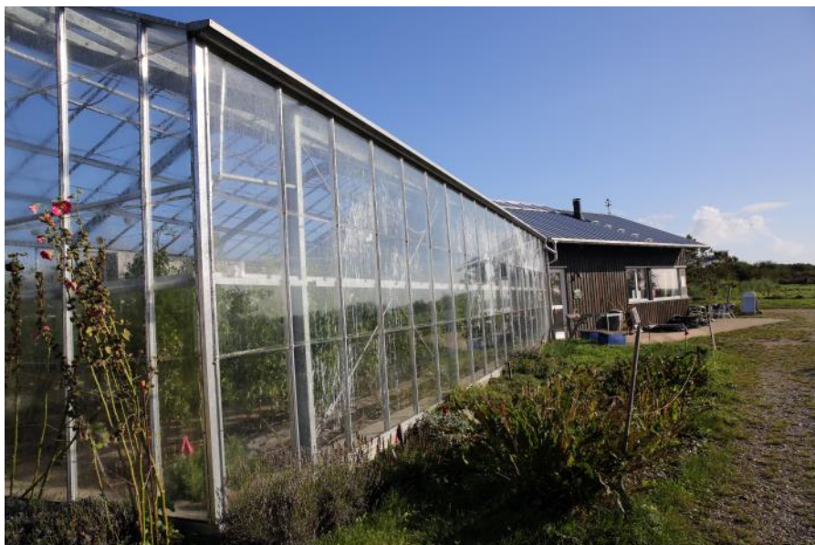
Drivhuset i sol.