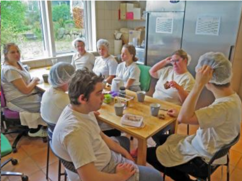
De travle bagere holdt også velfortjente pauser i november...