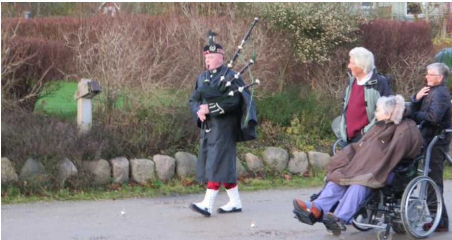
Piber (men ingen trommer) spillede til Ole U. ' fødselsdagsfest (se også side 12 og 23)