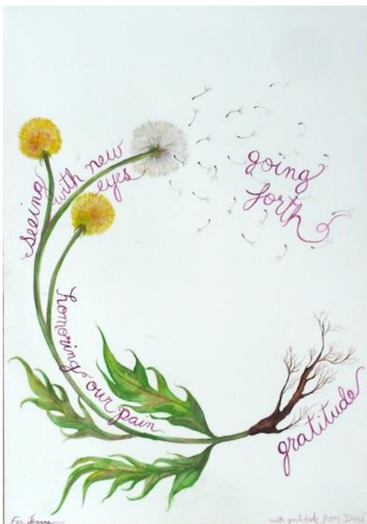
Spiralen fra The Work that Reconnects.

For mig handler den vigtigste læring fra uddannelsen om vores gruppeproces. Vi lærte kollektivt og blev dermed hurtigt bedre til vores gruppeprocesser, selvom det ikke var helt nemt i starten. Vi lærte hurtigt at fokusere på relationerne i stedet for resultatet - for når vi trives i relationerne, bliver resultatet hurtigt og nemt godt. Vi lærte, at alle stemmer er lige vigtige. Den hurtigste kan bruge sit overskud til at løfte andre i gruppen ved f.eks. at spørge: Hvordan hjælper jeg bedst hele gruppen videre nu?