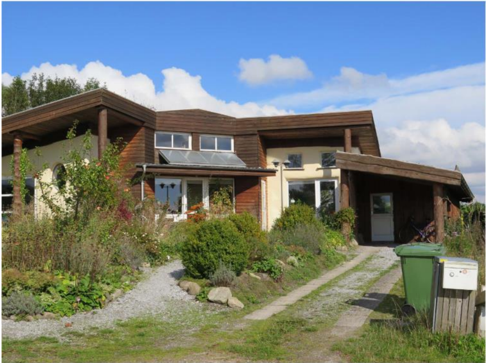
2-værelses lejlighed med hems til salg i halmhus i Hertha