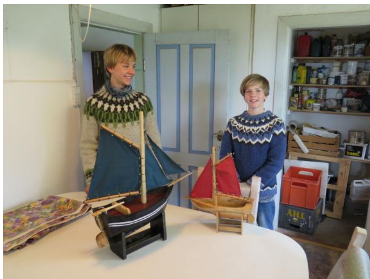
To dygtige bådbyggere med både, som de har bygget på værftet på Engvej 1.