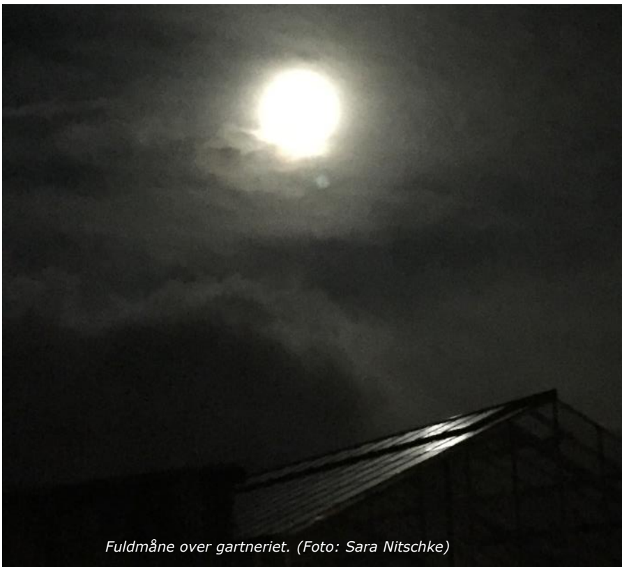
Fuldmåne over gartneriet.