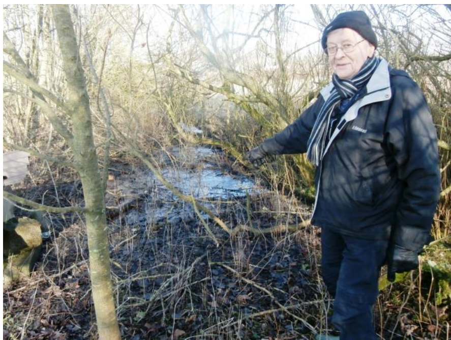
Ved svinget SØ for Bøgeskovvej