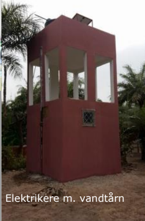
Elektrikere m. vandtårn