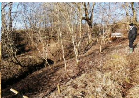
Ved bækken ned mod Bøgeskovvej