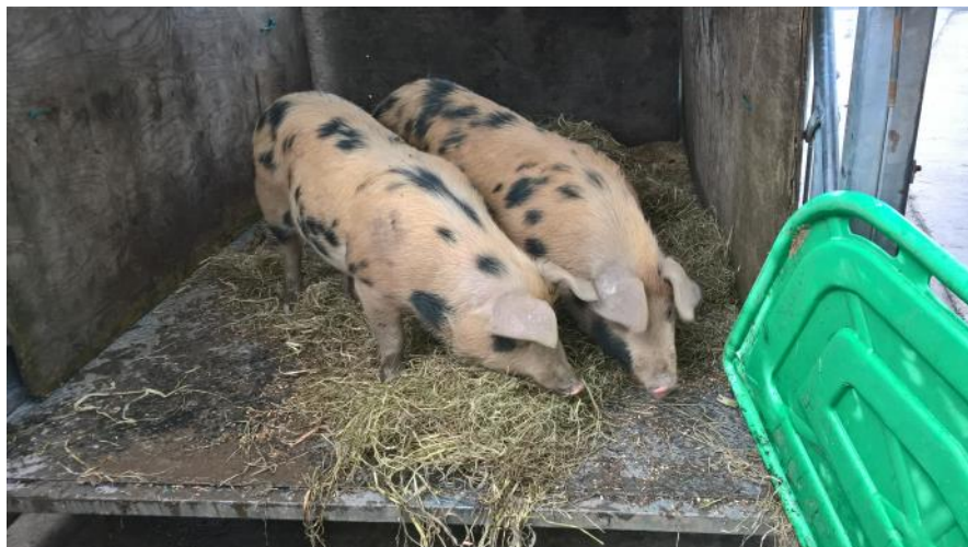
De to hangrises sidste rejse...

et godt sted at ligge. De to hangrise blev slagtet i uge 8 og ligger nu fordelt i diverse frysere.