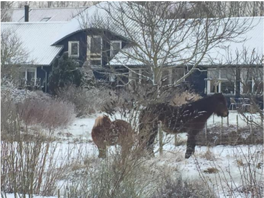
Lidt vinter på Valentin's dag♥ Hestene nærmest "stener"