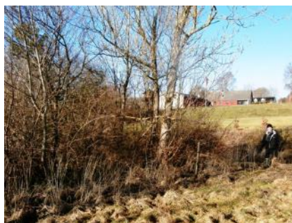
Ved nedgang til Bøgeskovvej 8, nedkørsel