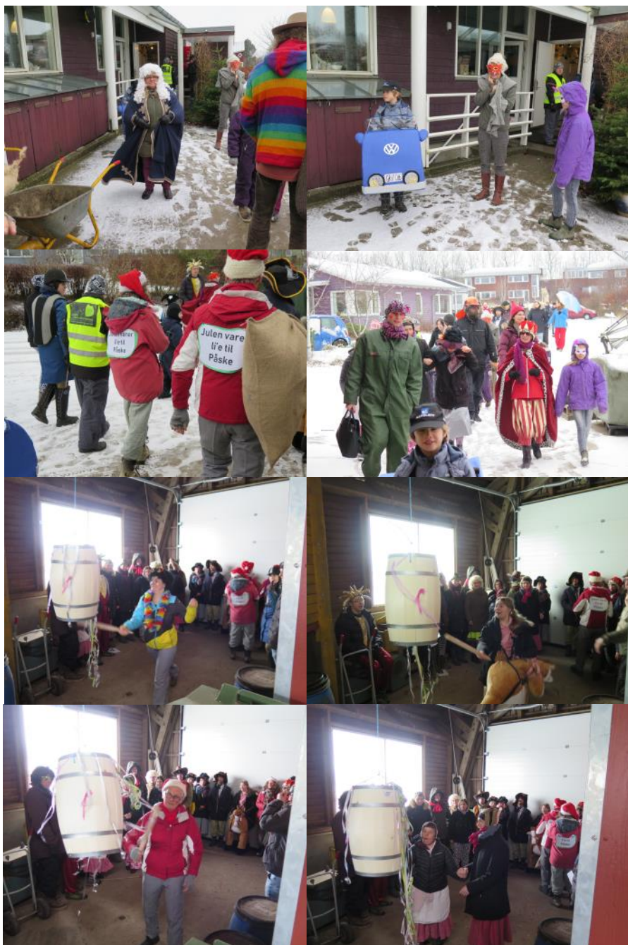
Fastelavnsfest i Hertha