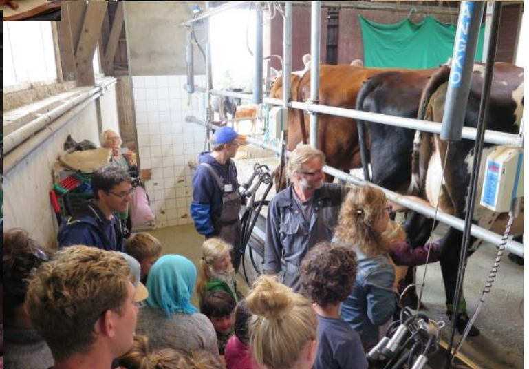
ette) afskrækkede ikke børnene. Vore gode volontører tog deres tørn i boderne. God interesse for infor- el. Stor interesse for at se en rigtig ko med rigtige horn. Og for at prøve at malke en ko.