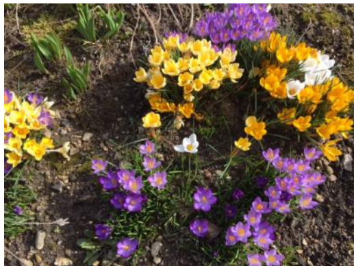
Forårstegn ved gartneriet