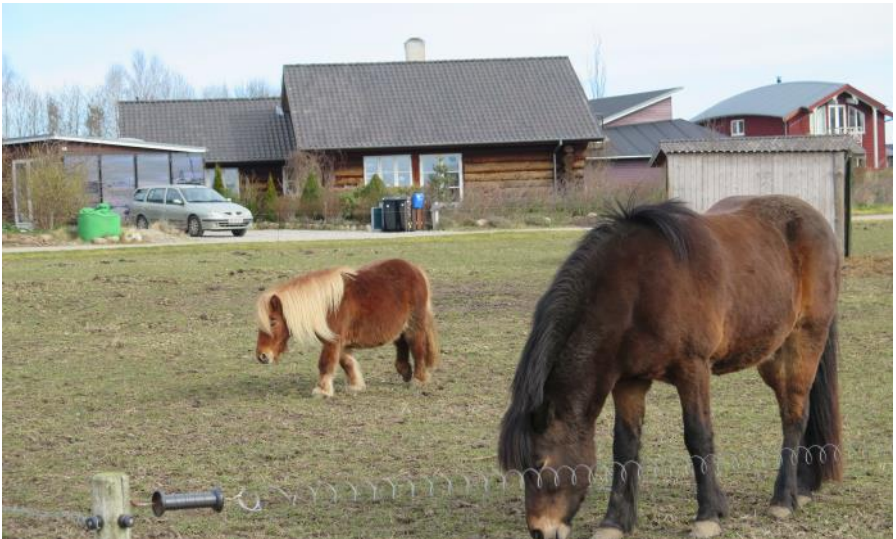
Den "nye" og den "gamle" hest