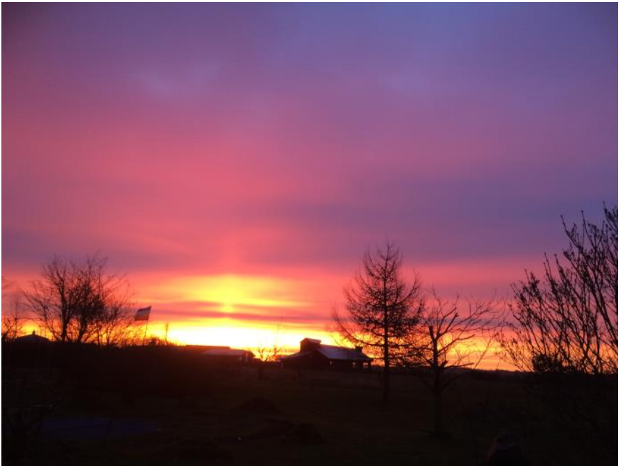
Morgenstund har guld i mund, og guld betyder glæde.... Taget fuldmånedagen søndag den 12.3. Der er lys og forår på vej...