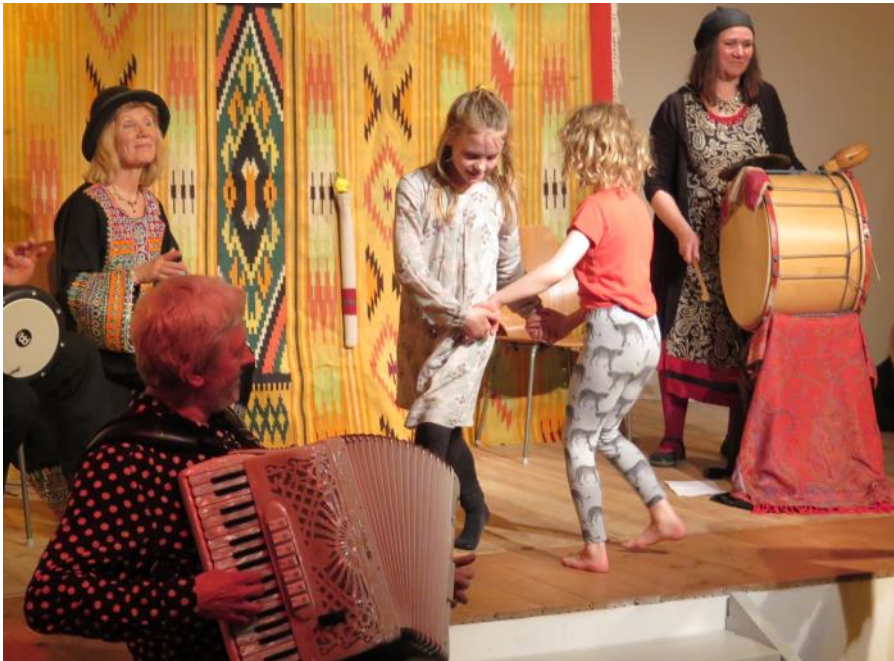
Fra 21-års festkoncerten

Tante Hertha er Hertha Levefællesskabs informationsblad, som udkommer ca. d. 1. i hver måned.