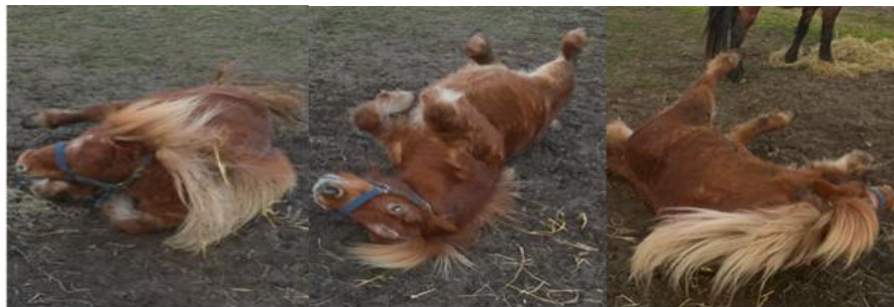
Det er godt at blive rullet, når nu man er en hest og har stået inde i en stald i længere tid.