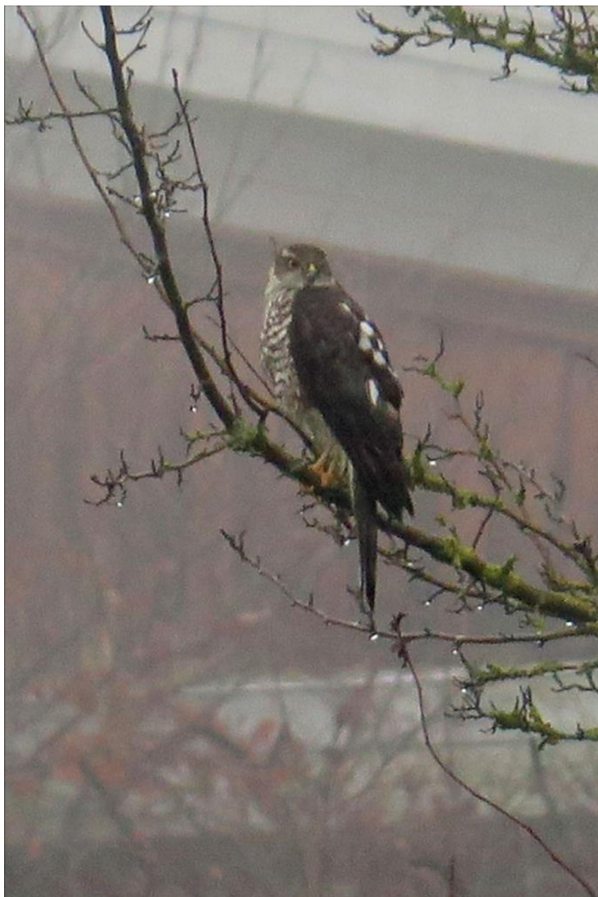
Sidste måneds Spurvehøg kom ikke helt til sin ret på bagsiden, så her er den igen.