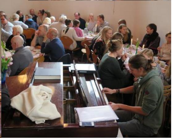
Indtryk fra den festlige fejring af Hertha Levefællesskabs 21 års dag