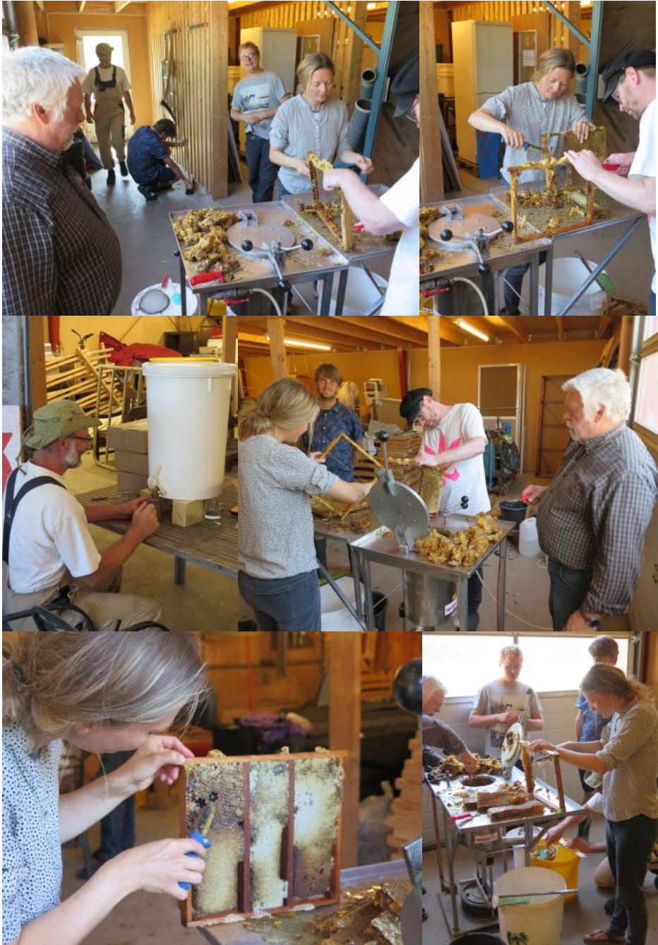
Honningpresning i Hertha