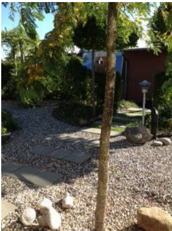
Min udsigt over mod bageriet