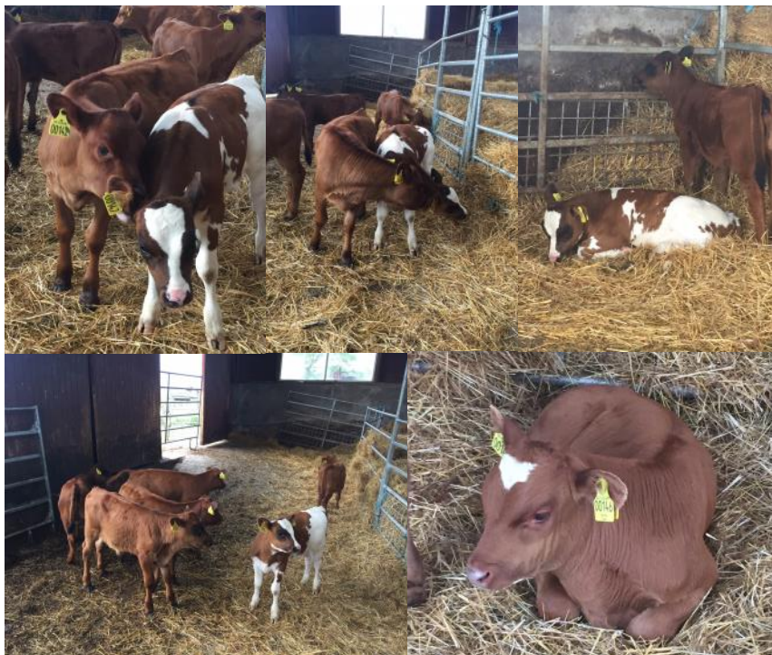
Nye Herthaborgere