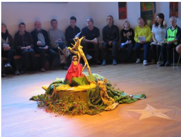
Stemmingsbillede fra morgensamling i michaelstiden.