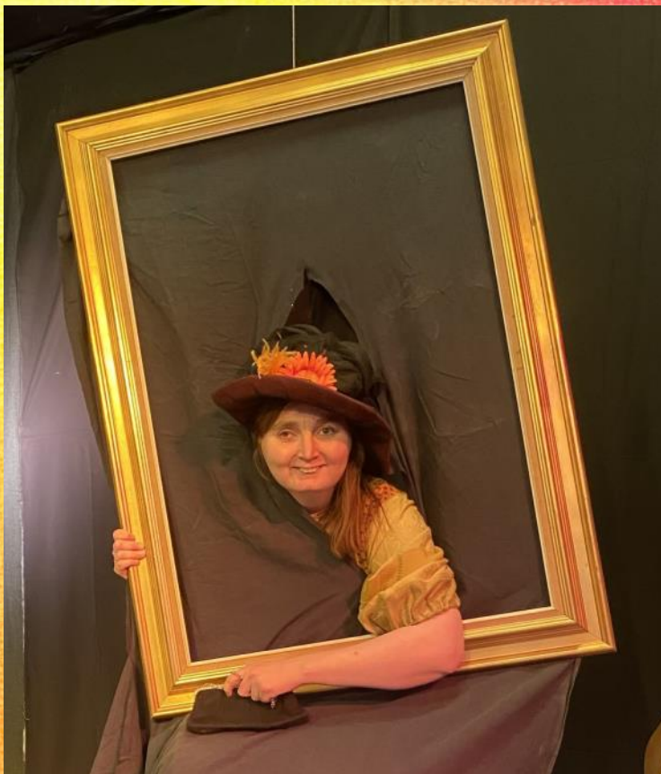
Et levende billede fra "Harry Pot- ter"