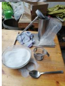
3 billeder af vores arbejde med at fremstille Kiselpræparat. Kvartskrytaller skal males til mel; det er nu klar til at blive gravet ned ved forårsjævndøgn. En stor tak til Nicolaj, Simone og Birgitte for en stor indsats.