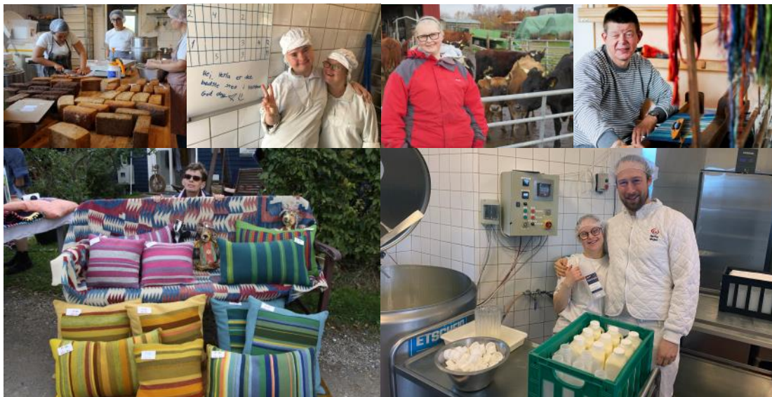
Glade værkstedsbrugere